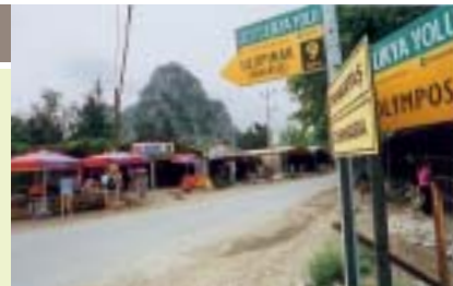
Çıralı: Einstieg in die Bergwelt