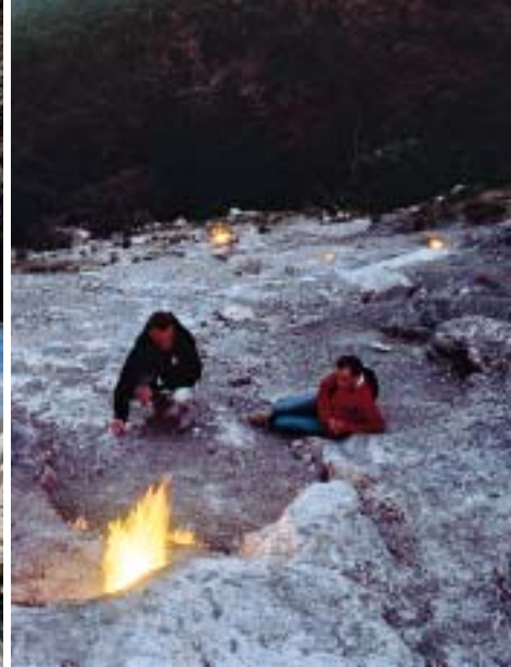
Flackerndes Geheimnis: Chimaera