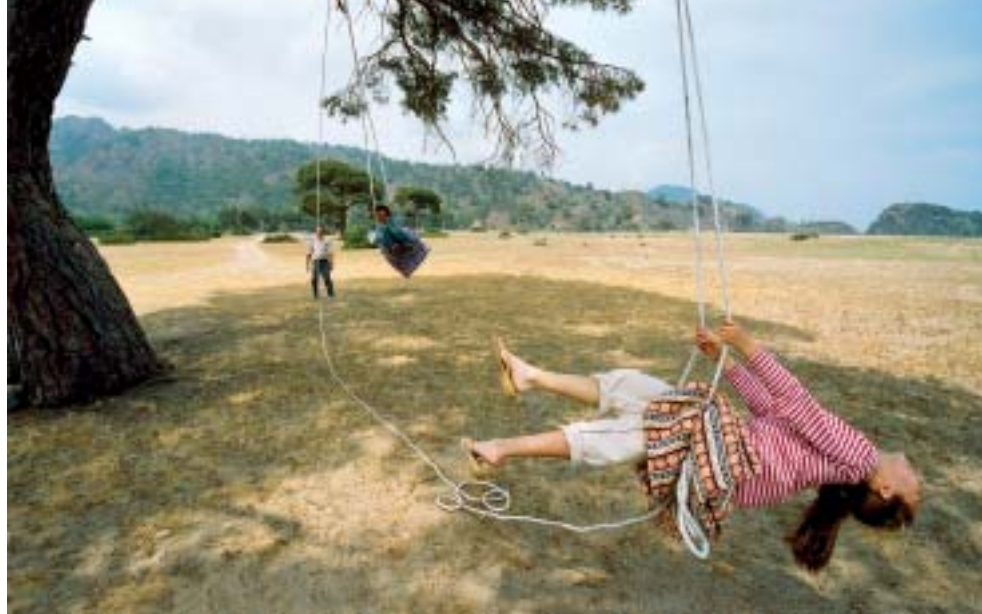
Am 6. Mai ist Hidirellez, Wandertag. Dann sieht man auch einmal Türken auf dem Likya Yolu