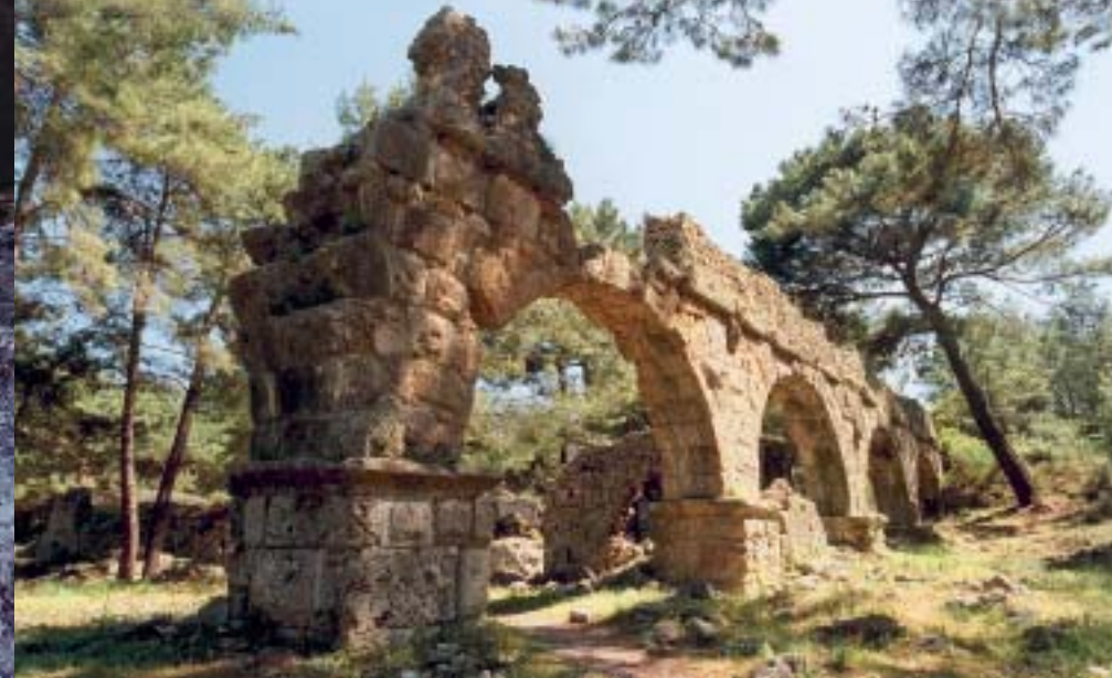
Wasser ist nah: der römische Aquädukt in Phaselis, der erfrischenden Station am Meer