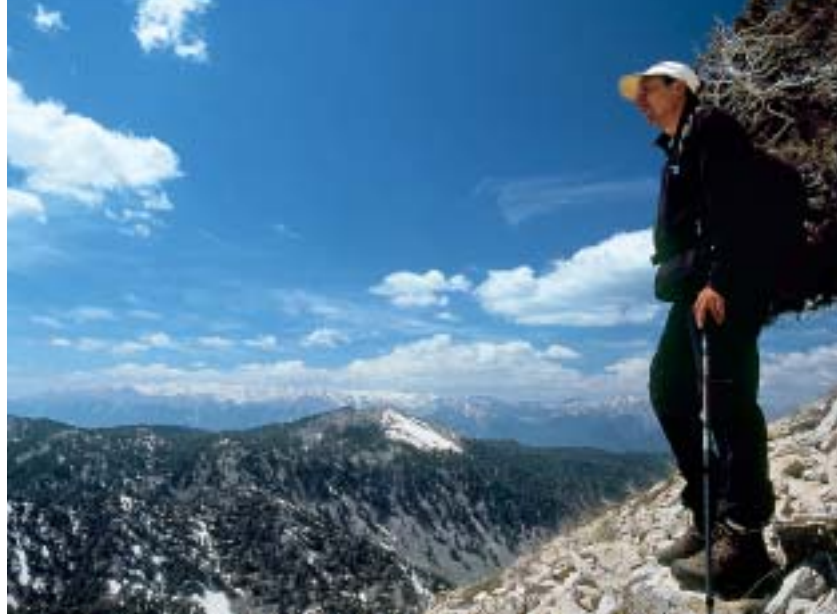
Blick zurück auf dem Weg zum Gipfel: Şerif Büyüktaş, der beste Kenner des Wegs